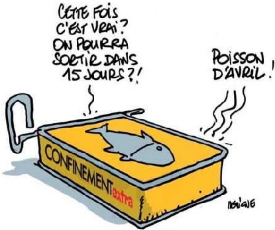
sans-titre4.jpg (30.19 KB)